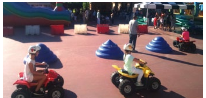
I bambini di Pieve, scatenati al tradizionale evento Bimbopoli , a cura della Pro Loco, che si è svolto lo scorso 13 settembre