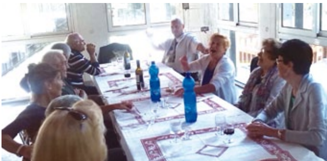
I cittadini di Pieve che hanno partecipato alla Festa delle Belle Età che si è svolta il 5 settembre alle Terme di Miradolo