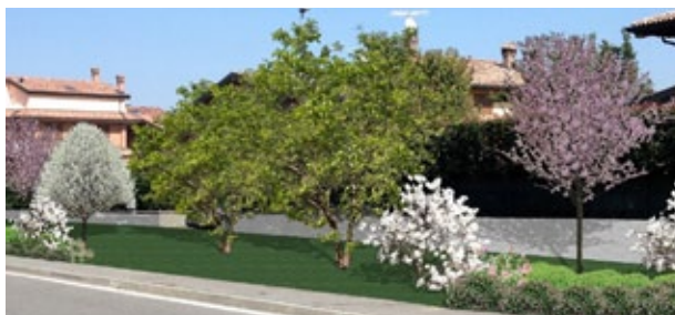
In foto i rendering delle nuove ripiantumazioni A sinistra, via Santa Maria Assunta. Sotto, via Vittorio Veneto

Auguro quindi a tutti una buona lettura e ancor di più Buon Natale!